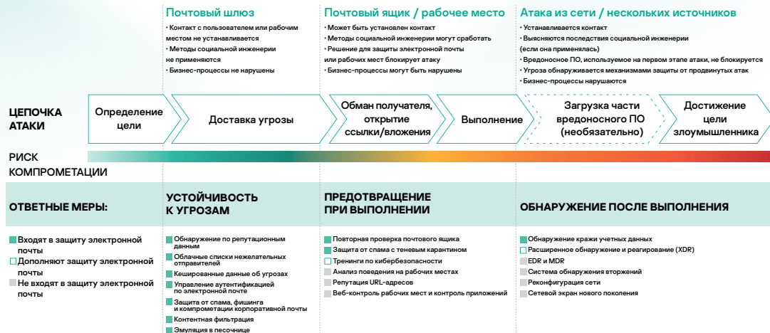
Роль защиты электронной почты на различных этапах цепочки поражения

Масштабируемая кластерная архитектура Kaspersky Secure Mail Gateway позволяет расширять возможности защиты по мере необходимости. Вам не придется жертвовать производительностью, чтобы поддерживать высокий уровень безопасности электронной переписки вашего растущего бизнеса.